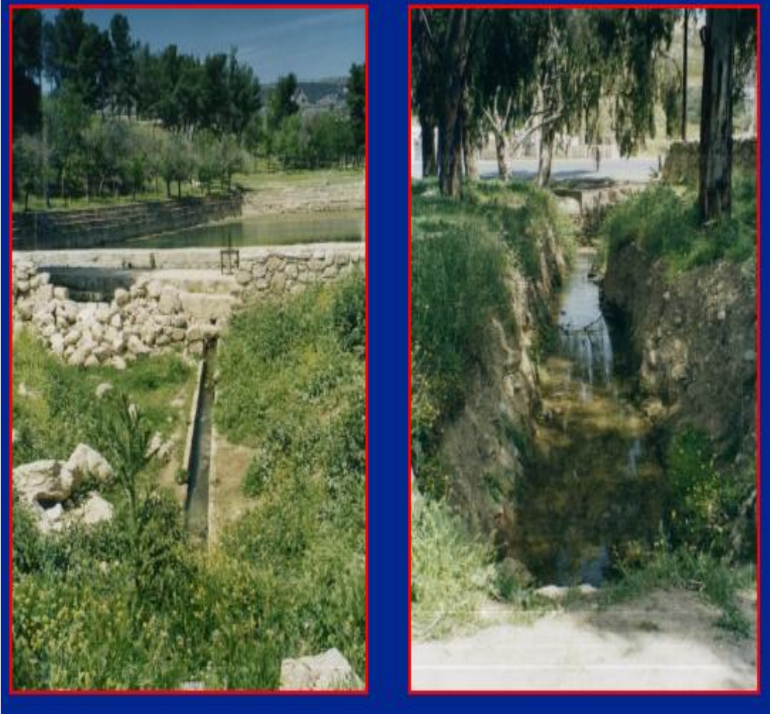
Plate (Photo) 1. A Photo of Qantara Spring Watershed